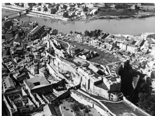
Fig. 5 Vista aèria del castell de la Suda, anys 1950

tenir res a veure, el llarg i costós (econòmicament parlant) empresonament de Jutglar al castell?