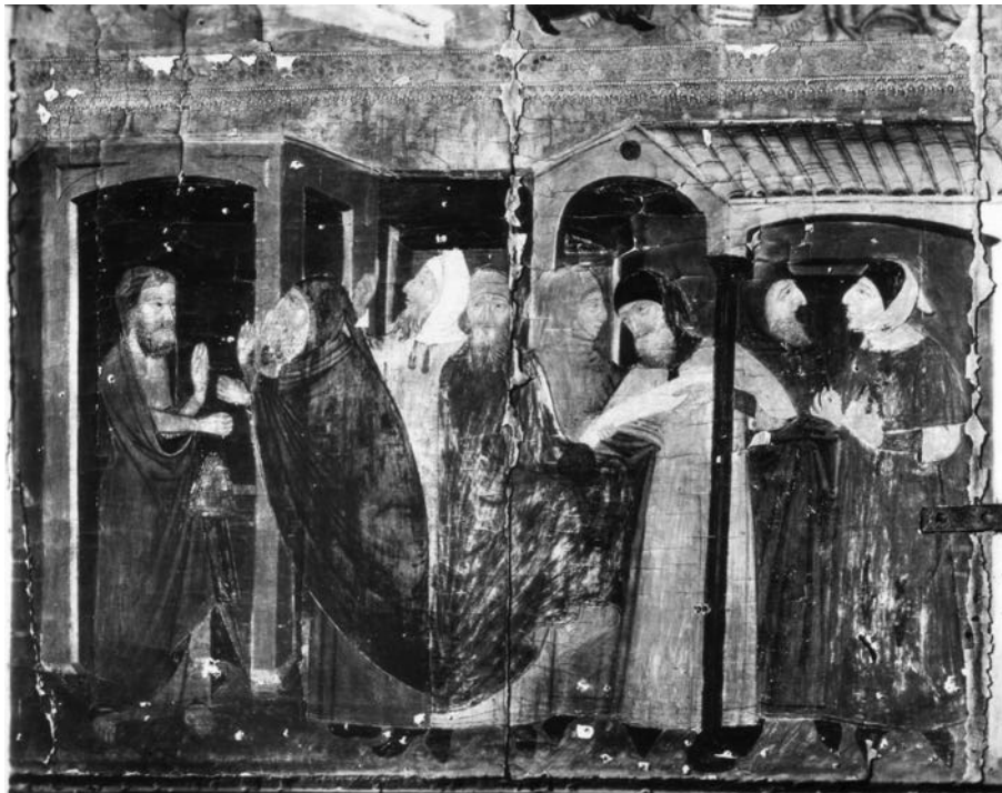
Fig. 6 Pintura posterior del retaule de la Mare de Déu de l'Estrella del segle XIV, catedral de Tortosa, 1930.

Tortosa, a part del seu pes específic en el sector comercial, amb el que això comportava d'oficis vinculats al trànsit de mercaderies, tenia tot el ventall d'oficis disponible —característics d'una ciutat del seu nivell— per aconseguir la seva pròpia autonomia. Dels oficis extrets dels fogatges i d'altres referències sabem que la ciutat disposava de sabaters, vidriers, ferrers, pellissers, cendrers, tenders, bastaixos, assaonadors, llauradors, pescadors, bracers, carnissers, fabridors, mariners, teixidors, trompadors, argenters, paraïres, canviadors, barbers, corredors, cirurgians, notaris, folquers, fariners, hortolans, homes de ribera, saigs, hostalers, sastres, fusters, espartenyers, boters, corders, calceters, coltellers, especiers, calafats, picapedrers, etc.