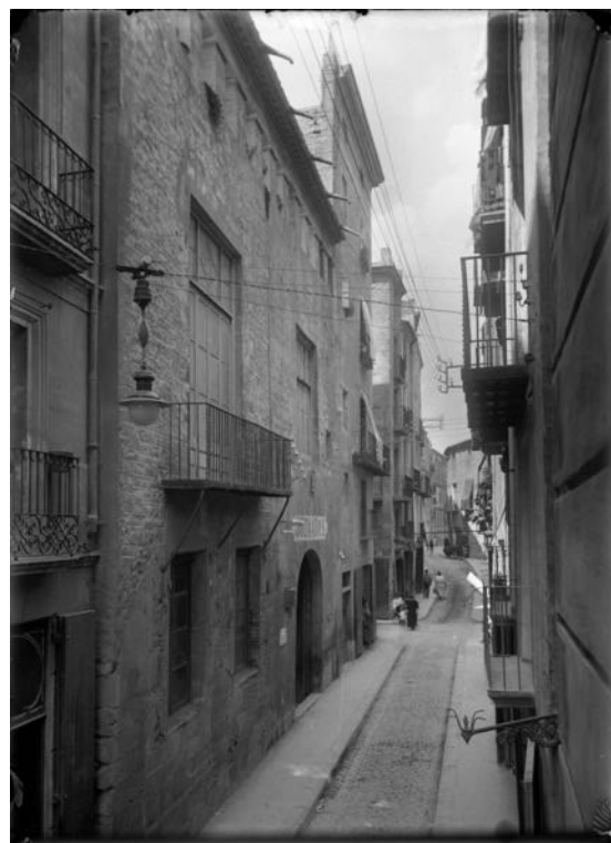
Fig. 7 Carrer Croera, a on va haver l'intent d'avalot, 1910-1920

Fins al 1459, quan el rei Joan II concedeix a la ciutat el privilegi d'eleccions per insaculació, 9 els canvis de govern s'exercien pel sistema de coaptació, en el qual els membres sortints acabaven posant els entrants. Això va comportar una concentració del poder en poques famílies oligàrquiques que es va traduir en constants confrontacions (fins i tot armades), i que calia pal·liar amb arbitratges externs. Precisament, de forma coetània als fets relatats del frustrat