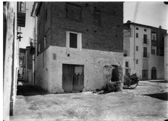
Fig. 10 Plaça del Platgé, al cor del barri de Remolins (antic call jueu), 1910-20