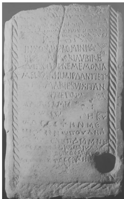
Fig. 8 Làpida trilingüe del segle VI, ubicada a la catedral de Tortosa, 2001

Respecte a la comunitat jueva instal·lada a Tortosa, encara no tenim proves concloents pel que fa al seu origen, si bé és cert que ja existia durant el període de dominació andalusí. La cèlebre làpida trilingüe, que segons alguns historiadors data del segle VI, ens remet a uns orígens ben allunyats. Durant aquest primer període no sabem