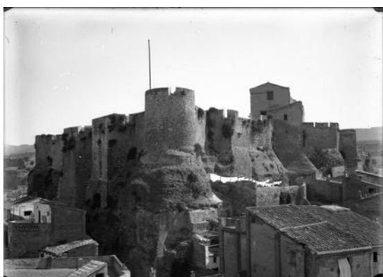
Fig. 4 Proa del castell de la Suda, a on es van refugiar els jueus el 1391, 1910-20