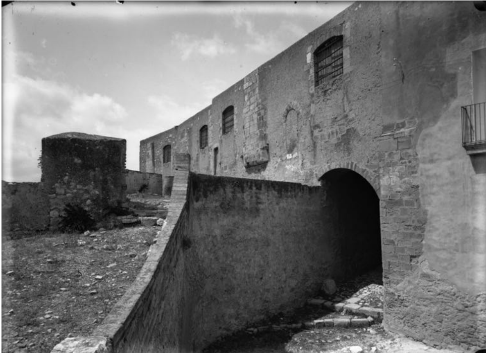
Fig. 1 Porta d'entrada al recinte superior del castell de la Suda, controlada per Jutglar, 1910-20 (Arxiu Comarcal del Baix Ebre, Fons Ramon Borrell; autor Ramon Borrell)

recinte del castell, que seria —per dir-ho d'alguna manera— com una presó provisional especial per a casos de deutes a particulars encara no sentenciats. 1