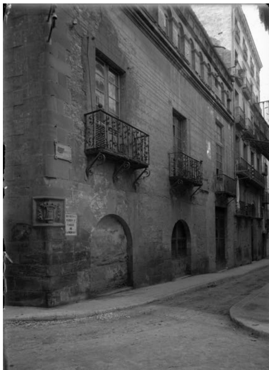
Fig. 3 Façana posterior de la casa de la Vila, a on van empresonar primerament a Jutglar, anys 1910 (Arxiu Comarcal del Baix Ebre, Fons Ramon Borrell; autor Ramon Borrell)

La inculpació que el carceller va fer sobre les autoritats tortosines li va comportar que, en passar per davant la Casa de la Ciutat, l’empresonessin i li instruïssin un procés acusant-lo d’instigar el poble a avalotar-se contra les autoritats. De dins estant, cridava la seva innocència, però amb expressions que es podien entendre com nous arguments per amotinar el poble. Els procuradors de la ciutat van admetre la delicada situació quan ja estaven sota sospita per mantenir i defensar els jueus i l’aljama del rei. L’atmosfera que es respirava, segons podem percebre a partir de les declaracions dels testimonis, era que només calia una guspira perquè tot plegat esclatés en un avalot.