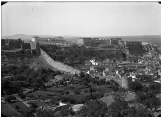
Fig. 9 Barri de Remolins (antic call jueu de Tortosa), 1910-20

Com s'ha apuntat, i seguint l'evolució genèrica de les comunitats jueves, van sofrir una evolució. Si durant el segle XII i bona part del XIII tenien el seu paper fins i tot preponderant dins la societat cristiana, a partir del segle XIV es van anar succeint agressions i vexacions. Un fet paradigmàtic era el tracte que es feu al cementiri jueu, que ja va requerir des del 1346 que les autoritats tortosines prohibissin que s'hi aboquessin fems o que s'hi tragués terra. Però foren les mateixes autoritats les que el 1368 van apropiar-se les làpides i d'altres pedres del fossar com a material constructiu per al clos de les muralles. 12 En aquest apartat d'animadversió progressiva cal situar les agressions que rebien al call, especialment el darrer terç del segle XIV, i en concret durant la Setmana Santa. També és prou simptomàtic el jurament vexatori que se'ls exigia en segons quina transacció i que es trobava recollit al Llibre de les Costums .