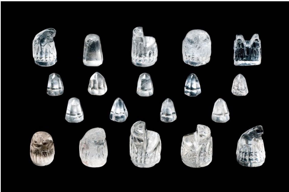
Fig. 1 Peces del joc d'escacs procedent de Sant Pere d'Àger.

Arsenda, en el seu testament, esmenta "les nostres taules d'escacs", que deixa al seu marit, Arnau Mir de Tost. Podem interpretar que es refereix a les magnífiques peces de cristall de roca de producció fatimita que, en part, es conserven al Museu de Lleida.