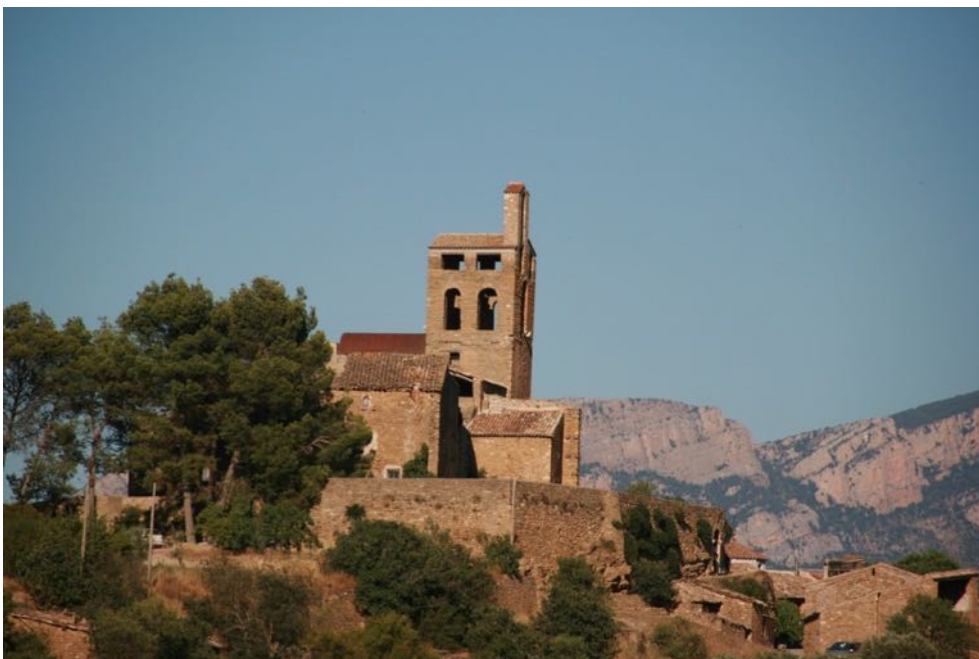
Fig. 3 Col·legiata de Sant Pere d'Àger amb la serra del Montsec al fons.

Els escacs s'havien convertit en un entreteniment freqüent entre la noblesa, la seva difusió a partir del segle XI coincidí amb moments d'intercanvi entre el món cristià i musulmà, quan es va difondre un sentit més refinat de la vida en el marc de la cultura cavalleresca. Probablement eren afeccionats a jugar-hi, ja que sabem per l'inventari d'Arnau Mir que en tenien tres jocs: un de cristall, un d'argent i un d'ivori. En l'ambient cavalleresc simbolitzen el joc de l'amor, tal com es representa a les arque amatòries dels darrers segles medievals. És un joc compartit entre homes i dones que dona a ambdós la possibilitat de moure les peces.