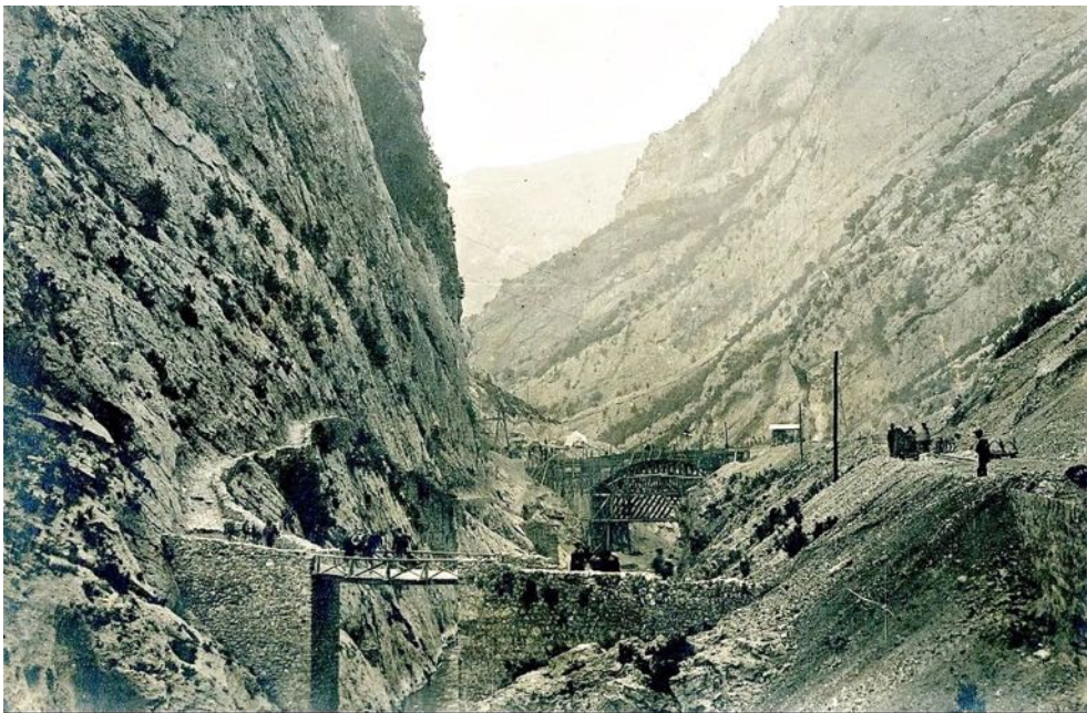
Fig. 2 Vista parcial del riu Noguera Pallaresa al seu pas pel congost de Terradets, amb el pont medieval al fons de la imatge.